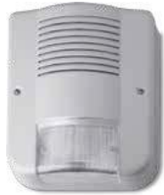
CITY HP TS85 HP